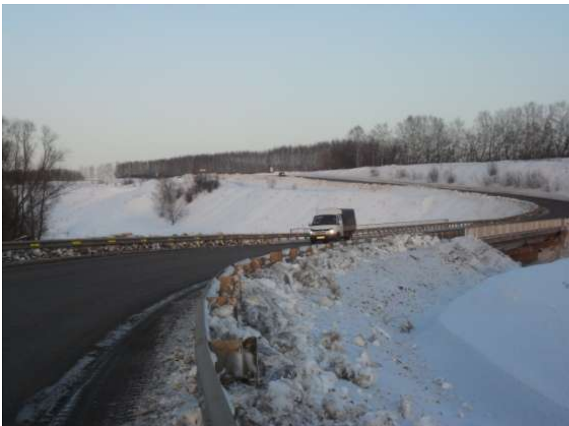
Авылны урталы бҮлөп Себер тракты үтө