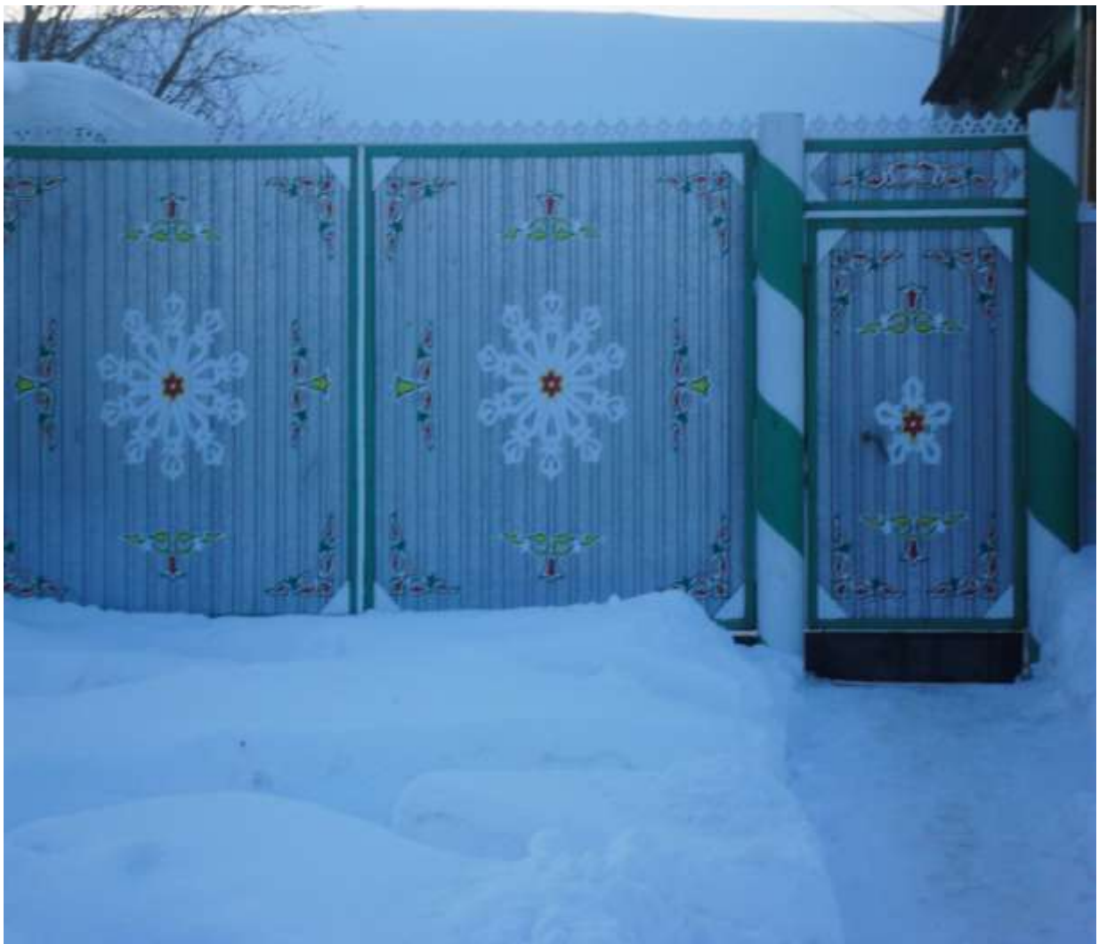
Мәдәният өлкәсендә эшләүче Харисов Рәдиснең үзе бизәгән капкасы