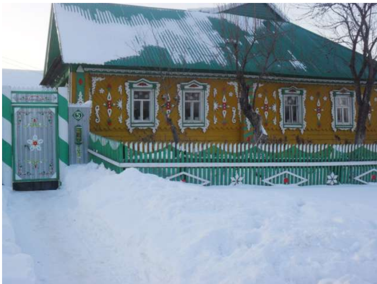
Мәдәният өлкәсендә эшләүче Харисов Рәдиснең өе