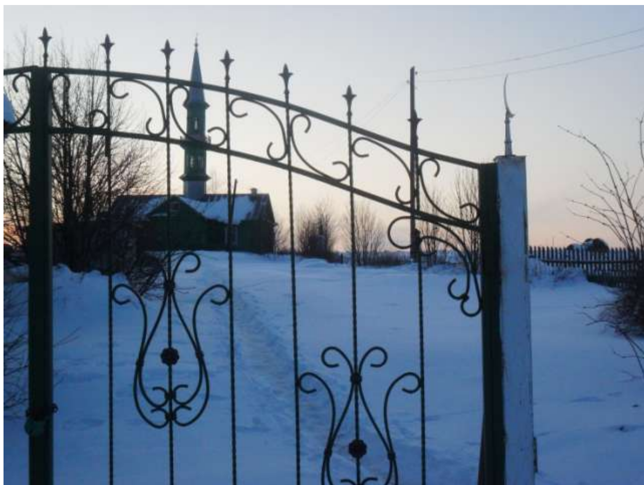
Авыл уртасында мәчет урнашкан