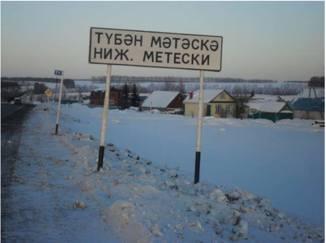
Татарстан Республикасы Арча районының Түбән Мәтәскә авлы Казан-Пермь юлының 71 нче километрында урнашкан