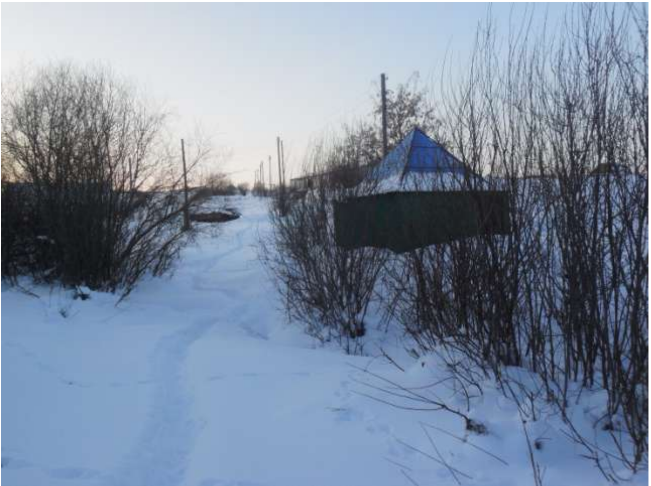
Инеш буенда авылның коесы