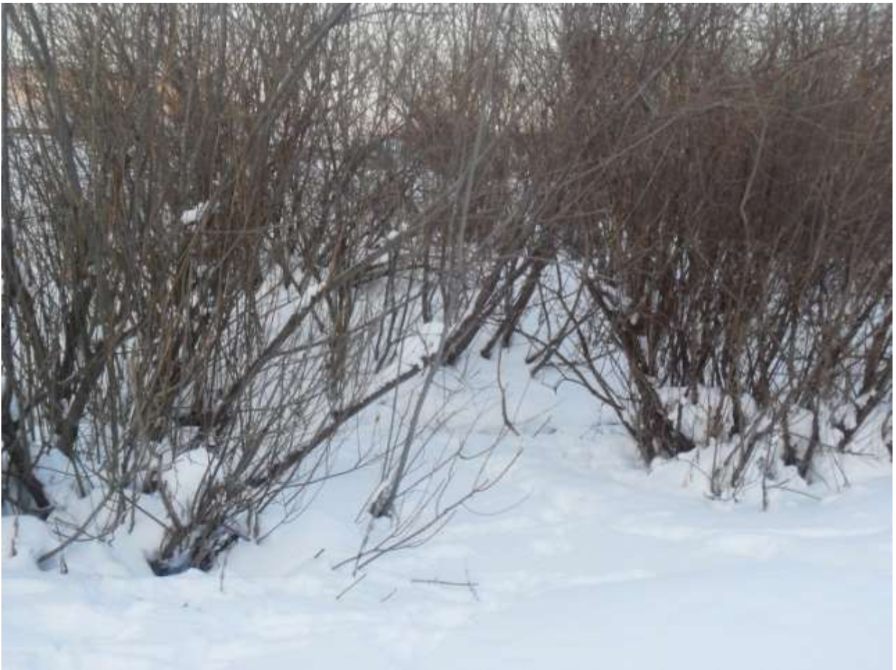
Кечкенә генә инеше- Ия елгасы ага