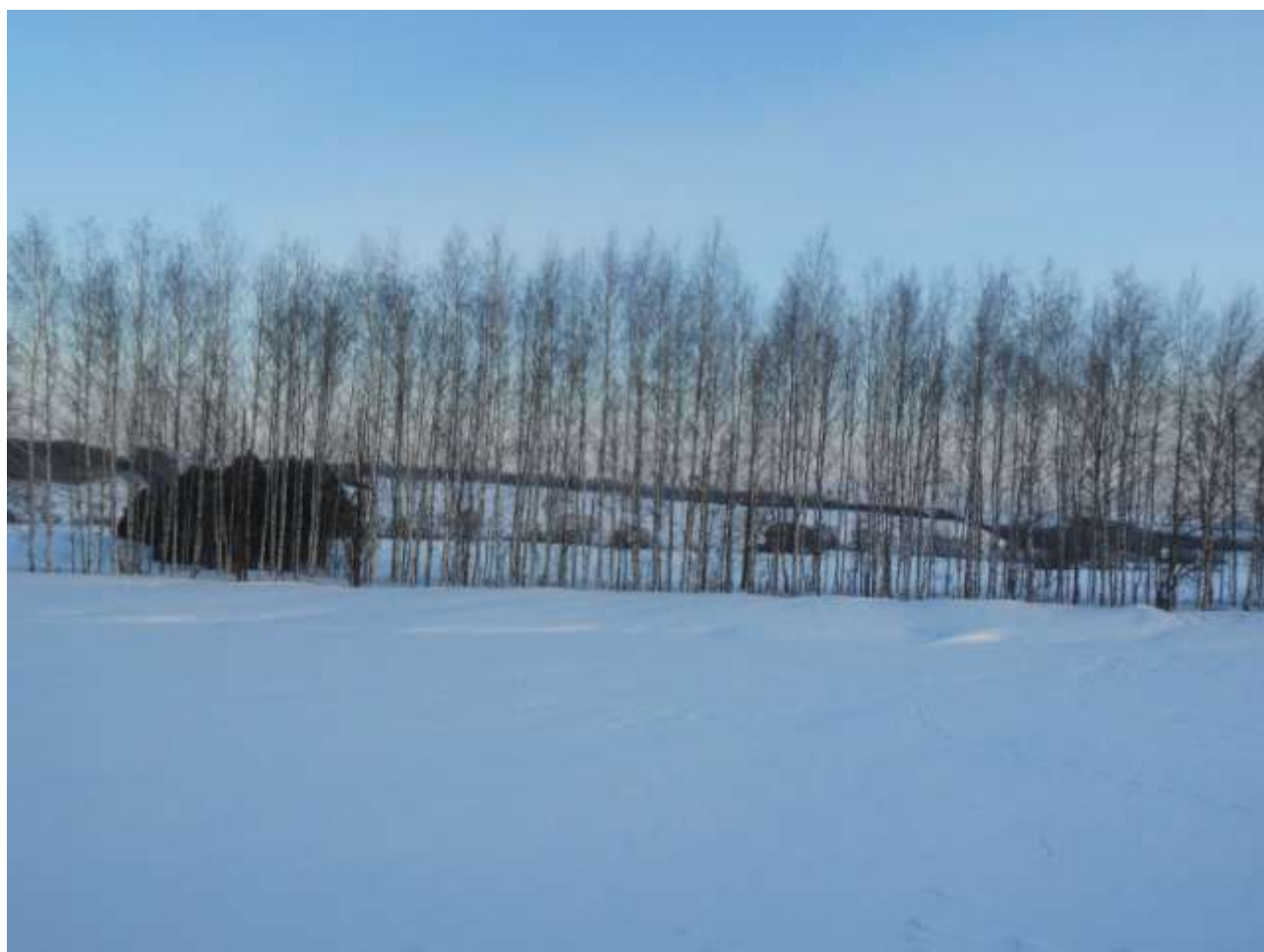
Туган авылымның табигате бик матур